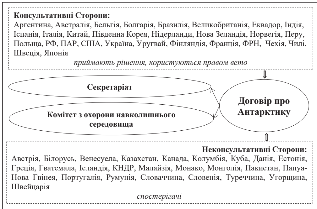
Рис. 2. Учасники Договору про Антарктику

Договором про Антарктику визначено систему управління регіоном: вищим колективним міжурядовим органом є Консультативні наради, які проводяться щороку. Членство у договорі є дворівневим: консультативні сторони та неконсультативні. До вищого органу – Консультативних Сторін – належать 12 держав-першопідписантів та 17 держав, що приєдналися згодом. Вони користуються консенсусом при прийнятті рішень та мають право вето. Нижчий управлінський орган – Неконсультативні сторони – представлені державами, що приєдналися до Договору, але не здійснюють на постійній основі науково-дослідницьку діяльність в регіоні. Вони беруть участь як спостерігачі без права голосу при прийнятті рішень з 1983 р. (рис. 2).