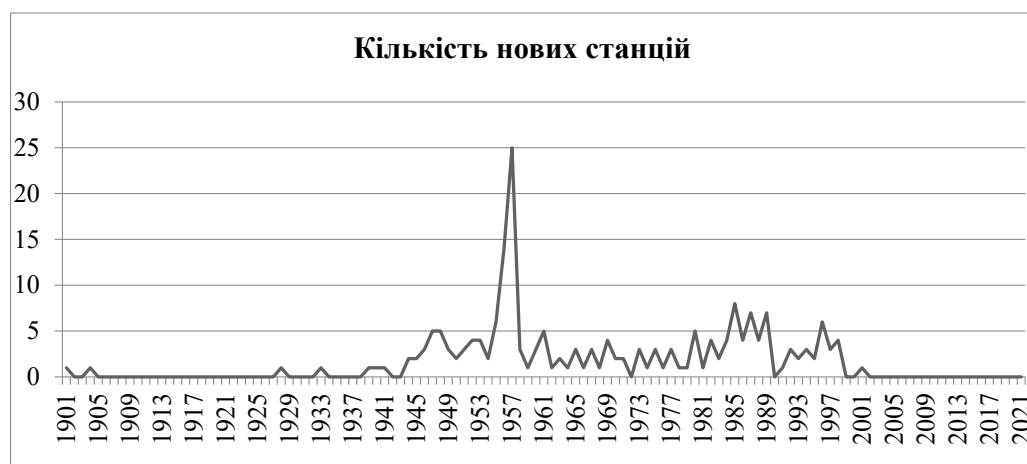
Рис. 1. Кількість нових станцій в Антарктиці

Це потребувало напрацювання мирного врегулювання міждержавних та міжнародних відносин в регіоні. Так виникла ідея створення єдиного інституту міжнародного регулювання в Антарктиці. Ним став Договір про Антарктику, який був підписаний в 1959 р. та ратифікований 1961 р. 12 державами – Австралією, Аргентиною, Бельгією, Великобританією, Новою Зеландією, Норвегією, Південно-Африканським Союзом, СРСР, США, Францією, Чилі, Японією [4]. Наразі до нього доєдналися 54 держави, в тому числі й Україна. Він є першим міжнародним військово-політичним договором щодо контролю над озброєнням, демілітаризації материка, підписаним за часів «холодної війни». Його основні положення декларують цілі мирного використання Антарктики в інтересах усього людства; обмін науковим персоналом, даними і результатами наукових досліджень в регіоні; заборона заходів військового характеру; заборона на проведення ядерних вибухів та зберігання радіоактивних матеріалів; відкритість усіх об'єктів, суден для інспекції уповноваженими спостерігачами.