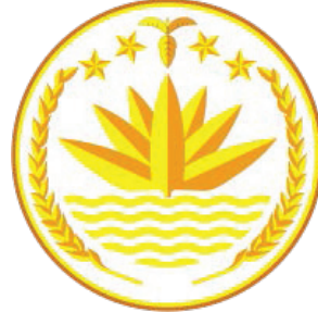
Рис. 5. Національний герб Бангладеш

Символічне зображення квіткової геральдики на державному рівні, використовують у приміщеннях парламентів, дипломатичних установах, офіційних документах, на печатках глави держави й уряду, грошових одиницях, паспортах тощо, тим самим підкреслюючи смислово-сакральне значення для країни. Дизайн герба з його атрибутивними відмінностями не тільки виступає специфічним джерелом інформації про природні ресурси, культурно-історичну спадщину народу, відтворюючи кольори національних прапорів, а й наголошує на провідній ідеї держави, національній єдності громадян у вигляді політичних гасел.