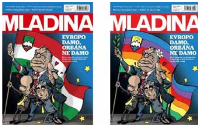
Рис. 2. Карикатура Т. Лавирча

Кількома роками раніше, а саме у 2019 році, газета The New York Times оголосила про відмову публікацій щоденних політичних карикатур у своєму міжнародному виданні та припинення співпраці з двома карикатуристами. Словенська газета Mladina в березні 2019 році на своїй обкладинці розмістила карикатуру на президента Угорщини В. Орбана, але під тиском угорських чиновників, які висловили обурення нею, газета опублікувала «виправлену та дружню» обкладинку, супроводжуючи цю заміну дописом, у якому зазначалося, що враховуючи лист угорського посла в Словенії, де містилося звинувачення в «потворному та злобному» зображенні улюбленого лідера угорського посла, наш карикатурист посипав голову попелом і цього разу намалював «нашого дорогого Віктора» «красивішим та привітнішим» (рис. 2) [17].