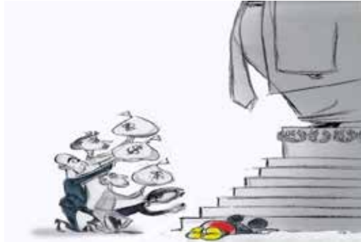
Рис. 1. Карикатура Е. Телнейс